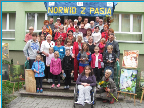
„Norwid z Pasją”, 2013