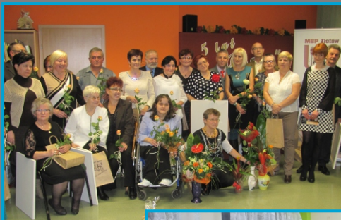
5 lat Klubu Pasji 2013

Pasjonaci uczestniczą z warsztatami w imprezach SM Piast, Festiwalach Rękodzielnictwa i Smaku w Wysokiej, w Jarmarku Krajeńskim w Złotowie i w Więcborku, Folk Krajna w Radawnicy, w warsztatach z okazji Euro-Eco Festiwalu w Złotowie i Marszu Różowej Wstążki, w szkołach i przedszkolach oraz w imprezach krajowych i zagranicznych. Przez dziewięć lat prowadzili także warsztaty z dziesięciu dziedzin sztuki i rękodzieła w Miejskiej Bibliotece Publicznej pt. "Norwid z Pasją".