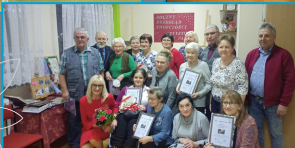
13 lat Klubu Pasji, 2021