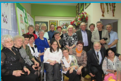
Otwarcie „Galerii z Pasją” 2017