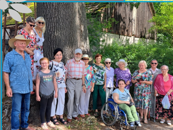
Plener w Samborsku, 2023