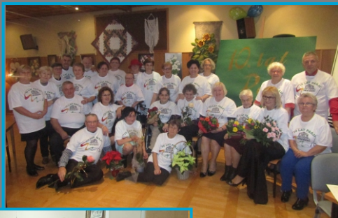
10 lat Klubu Pasji, 2018