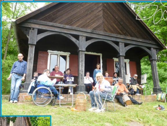
Plener w Stebionku, 2014