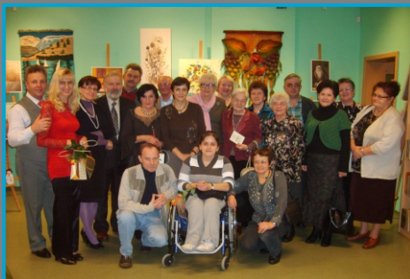
2 lata Klubu Pasji 2010

Pasjonaci uczestniczą z warsztatami w imprezach SM Piast, Festiwalach Rękodzielnictwa i Smaku w Wysokiej, w Jarmarku Krajeńskim w Złotowie i w Więcborku, Folk Krajna w Radawnicy, w warsztatach z okazji Euro-Eco Festiwalu w Złotowie i Marszu Różowej Wstążki, w szkołach i przedszkolach oraz w imprezach krajowych i zagranicznych. Przez dziewięć lat prowadzili także warsztaty z dziesięciu dziedzin sztuki i rękodzieła w Miejskiej Bibliotece Publicznej pt. "Norwid z Pasją".